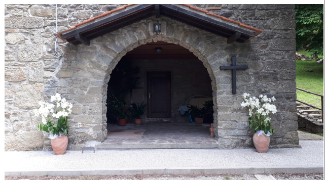
Località La Burraia, Montepiano (Prato)- Comunità di Maria Serva del Signore. Qui si recheranno le nostre famiglie il 30 maggio (vd. pag.seguente)